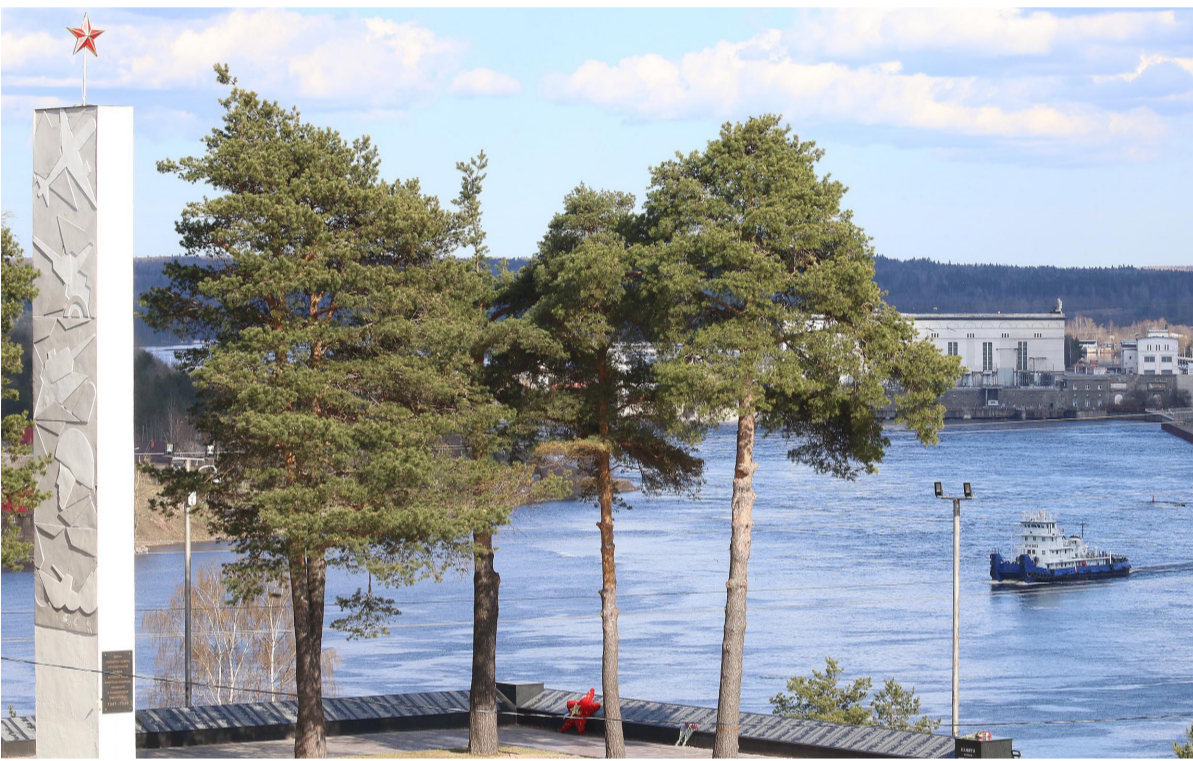
УВАЖАЕМЫЕ ЖИТЕЛИ ГОРОДА ПОДПОРОЖЬЯ И ПОДПОРОЖСКОГО РАЙОНА!